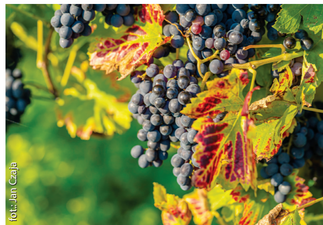
enoTARNOWSKIE – winnica