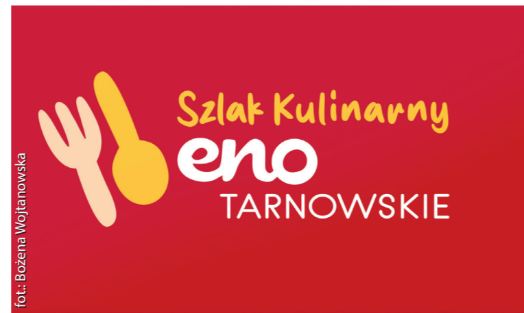
Szlak Kulinaryny enoTARNOWSKIE