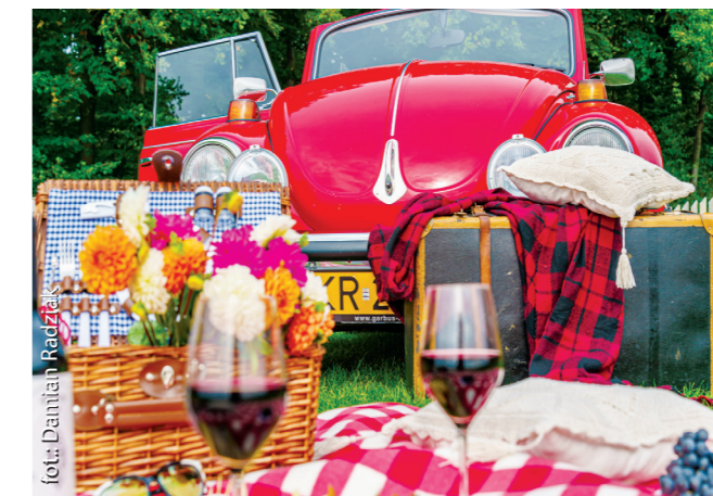
enoTARNOWSKIE – wyjątkowa trasa kulinarna