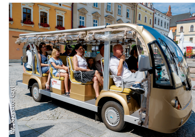
Enomeleksem po Tarnowie