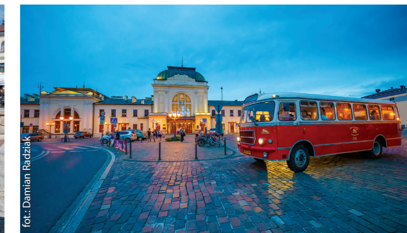
Zabytkowy autobus przed tarnowskim dworcem kolejowym