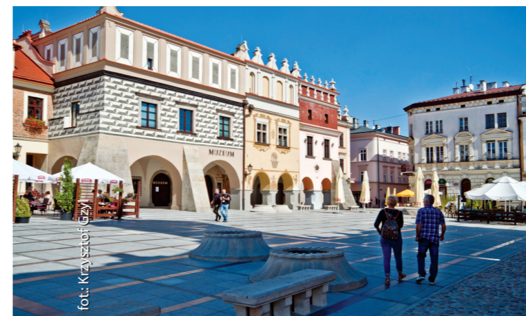
Renesansowe kamienice na rynku w Tarnowie