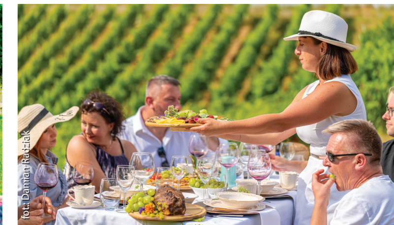
Zdrowa żywność, wyśmienite wina i wyjątkowa gościnność

Doroczne Święto Dyni w Rzuchowej. Sezon kończą organizowane już od dziesięciu lat Wielkie Tarnowskie Dionizje, czyli kilkudniowe święto wina i winiarzy organizowane w Tarnowie w połowie listopada. Rozpoczyna się na Starym Mieście od przemarszu winnego orszaku ze św. Marcinem na białym koniu na czele i prezentacji lokalnych winnic. Program wydarzeń uzupełniają warsztaty dotyczące np. łączenia potraw i wina.