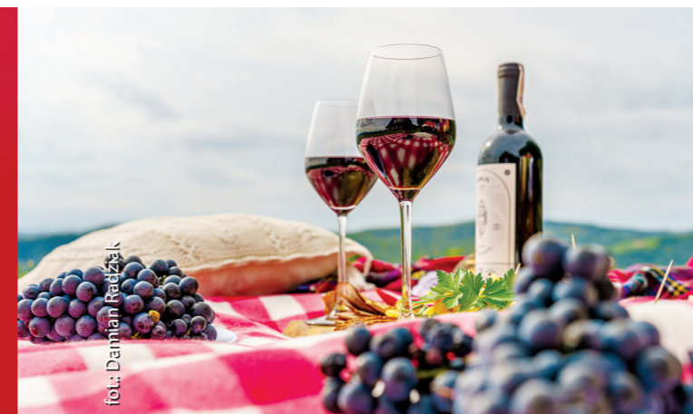
Slow Food Travel