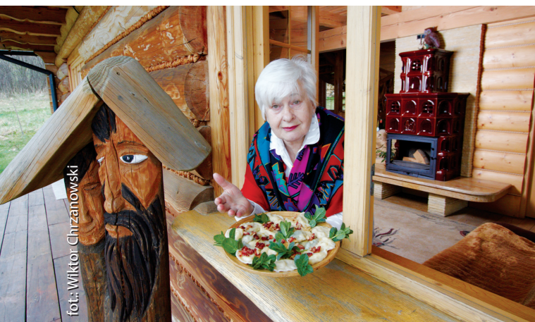
enoTARNOWSKIE – Szlak Kulinaryny