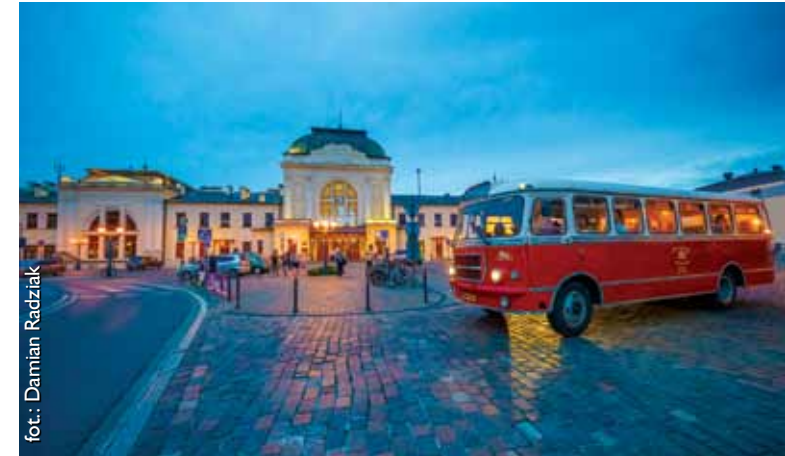
Zabytkowy autobus przed tarnowskim dworcem kolejowym