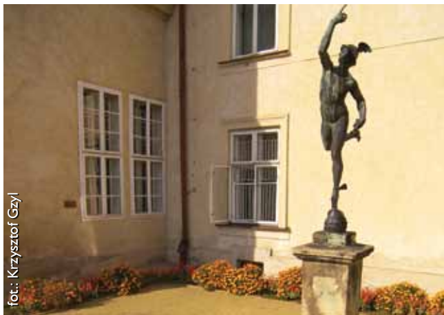
Pałac Sanguszków w Tarnowie

Poniżej linii drzew wybudowano basen letni, tężnię solankową, plac zabaw, Bike Park (4 trasy rowerowe „singletracki” o różnym stopniu trudności) oraz Centrum Biegowe Marcinka (z trasami do biegania, jazdy na rolkach, nordic walkingu i narciarstwa biegowego). Z ruin zamku roztacza się wspaniała