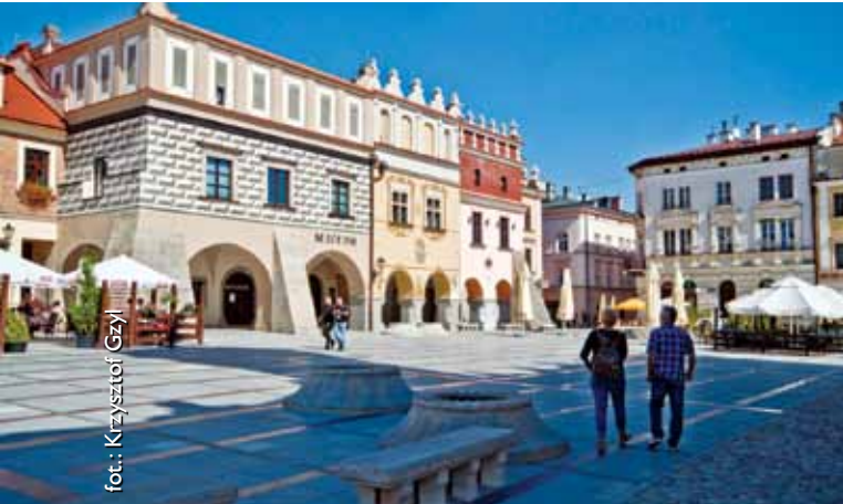
Renesansowe kamienice na rynku w Tarnowie