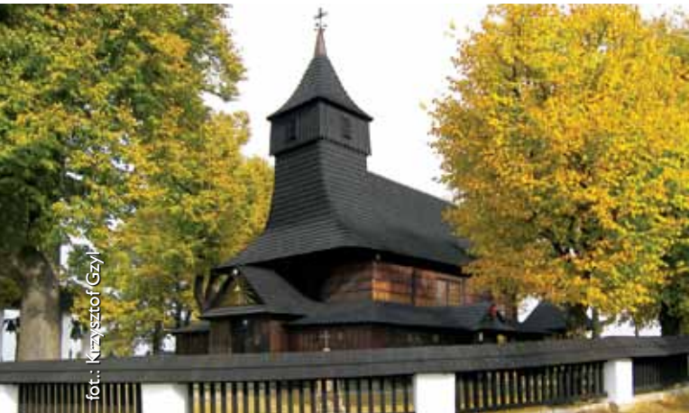
Kościółek św. Marcina na Górze św. Marcina w Zawadzie

To tutaj znaleźć można najwyższy w Polsce, siódmy pod względem wysokości na świecie, jesion wyniosły Fraxinus excelsior oraz najwyższy znany w Polsce i na świecie dąb szypułkowy Quercus robur . Wiek najstarszych drzew szacuje się na 120–140 lat. Na terenie parku znajduje się restauracja, plac zabaw oraz ruiny zamku Tarnowskich.