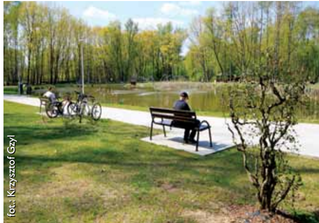
Park Piaskówka w Tarnowie

Tam w 1929 roku złożono szczątki generała Józefa Bema, ekshumowane z cmentarza w Aleppo. Po stronie południowej stoi neogotycki budynek, pierwotnie siedziba i strzelnica Towarzystwa Strzeleckiego. Po ostatniej renowacji ulokowano w nim Galerię Miejską Biura Wystaw Artystycznych. Warto nadmienić, że Park Strzelecki wchodzi w skład Małopolskiego Szlaku Ogrodów – projektu, który łączy ponad 40 założen ogrodowych od Muszyny przez Kraków, Oświęcim po Sądeczynę i Podhale. Pokazuje miejsca niebanalne, z ciekawą