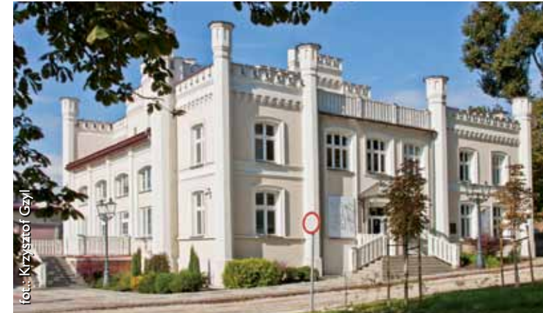
Pałac Strzelecki w Tarnowie

Drzewostan Plant tworzą w zdecydowanej większości drzewa liściaste. Na uwagę zasługują potężne kasztanowce w części