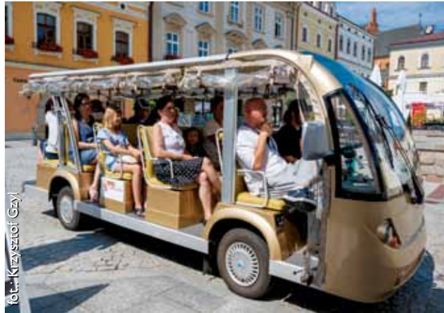
Enomeleksem po Tarnowie