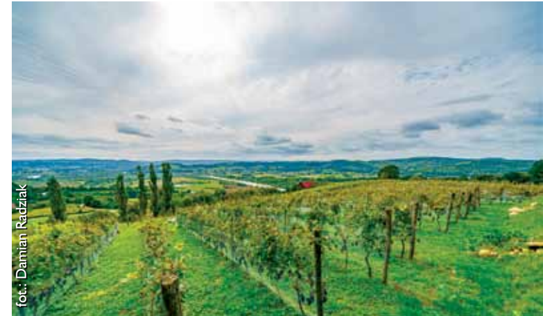
enoTARNOWSKIE dla każdego