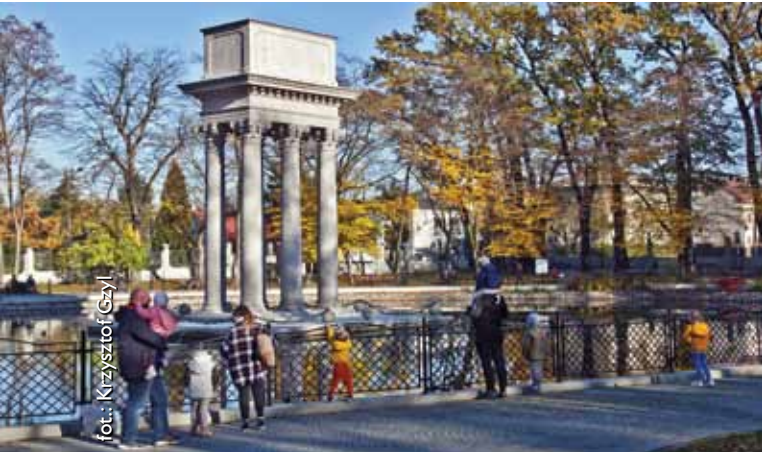
Mauzoleum gen. Józefa Bema w Tarnowie