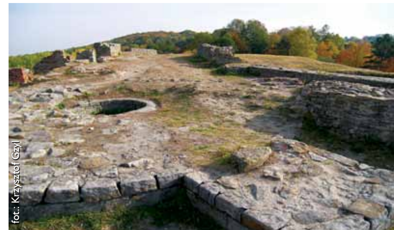
Ruiny zamku na Górze Świętego Marcina

Został założony na początku XIX wieku wokół powstającego tzw. pałacu letniego książąt Sanguszków. Wielokrotnie przekształcany, dziś ma charakter parku krajobrazowego w typie romantycznym. Na północ od pałacu, na terenie, który zajmuje starodrzew, znajdował się staw. Natomiast część południowa to teren zagospodarowany w typie ogrodu włoskiego, z niedawno odremontowaną fontanną i statuą Merkurego. W dwu-